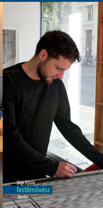
Sárg Gyula festőművész Berlín